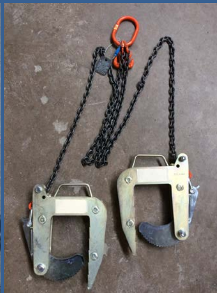
Connessione dispositivo MOD:219 doppio