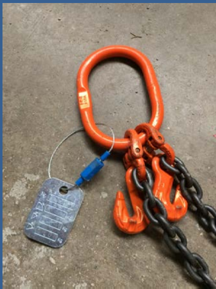
Catene e ganci