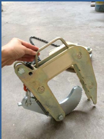
Dispositivo MOD:219 singolo